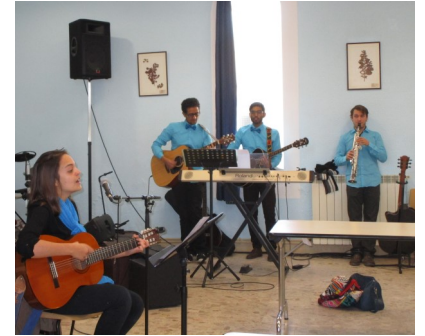
Répétition avec quelques musiciens

Les étudiants de l'Institut se sont déplacés dans plusieurs Eglises ce début de semestre ; à Périgueux, Libourne et Nantes. D'autres sorties sont prévues au mois de mai à Marmande, Cognac, La Teste et Dax. Ces sorties sont l'occasion de faire connaître l'ITB par la participation des étudiants, aux chants, témoignages, ainsi que par la prédication et la présentation des programmes et activités de l'Institut. Ces contacts avec les Eglises permettent une connaissance réciproque et un soutien plus fort dans la prière et l'implication des chrétiens.